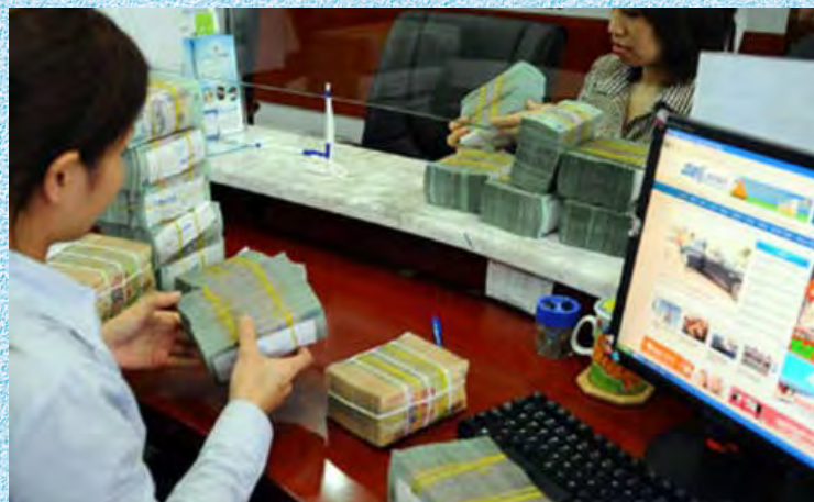
Doanh nghiệp nhỏ và vừa được hỗ trợ tín dụng

Việc hỗ trợ giá thuê mặt bằng cho doanh nghiệp nhỏ và vừa quy định nêu trên được thực hiện thông qua việc bù giá cho nhà đầu tư hạ tầng khu công nghiệp, khu công nghệ cao, cụm công nghiệp để giảm giá cho thuê mặt bằng đối